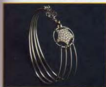
Comet Star: bracciale in oro bianco e brillanti. Bracelet in white gold and diamonds.

MY STAR, la linea di gioielli creata dalla designer italiana GRAZIELLA PALETTA, ha come tema la stella. Una stella particolare, "la mia stella", come la definisce la stessa designer, da dedicare ad una persona speciale. "Dedicated to My Star" è anche il nome della collezione a cui appartengono i modelli presentati