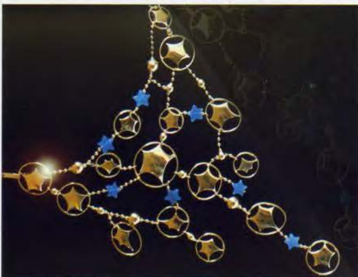
Constellation: collana a stelle doppie, in oro giallo e agata blu. Anche disponibile in oro bianco e giallo reversibile, e con brillanti. Necklace double star, in yellow gold and blue agate. Also available in white and yellow reversible gold, and with diamonds.

MY STAR, the line of jewels created by Italian designer GRAZIELLA PALETTA, is star-centred. A special star, "My Star", as the designer herself calls it, to dedicate to a special person.