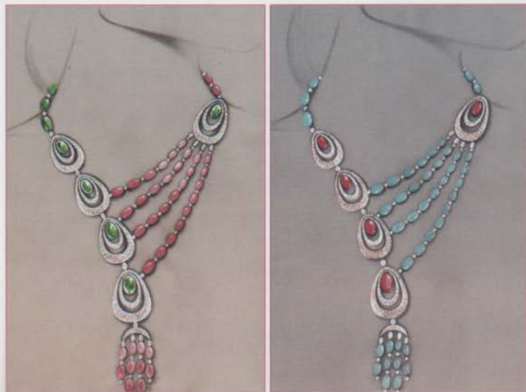
Side: "Lady Rose" choker, in pink gold, pink corals, diamonds and emeralds; "Lady Blue" necklace in turquoises, rubies, diamonds and pink gold. Harem collection by Graziella Paletta Luxury line.