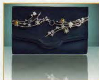
My Star Music: collana su borsa pochette blu da sera. Necklace on blue evening bag.

"Dedicated to My Star" is also the name of the collection to which the models presented in the page belong: